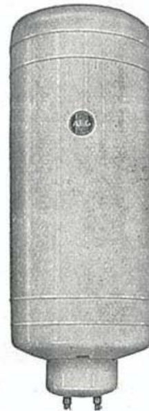
Type 30-120 litres